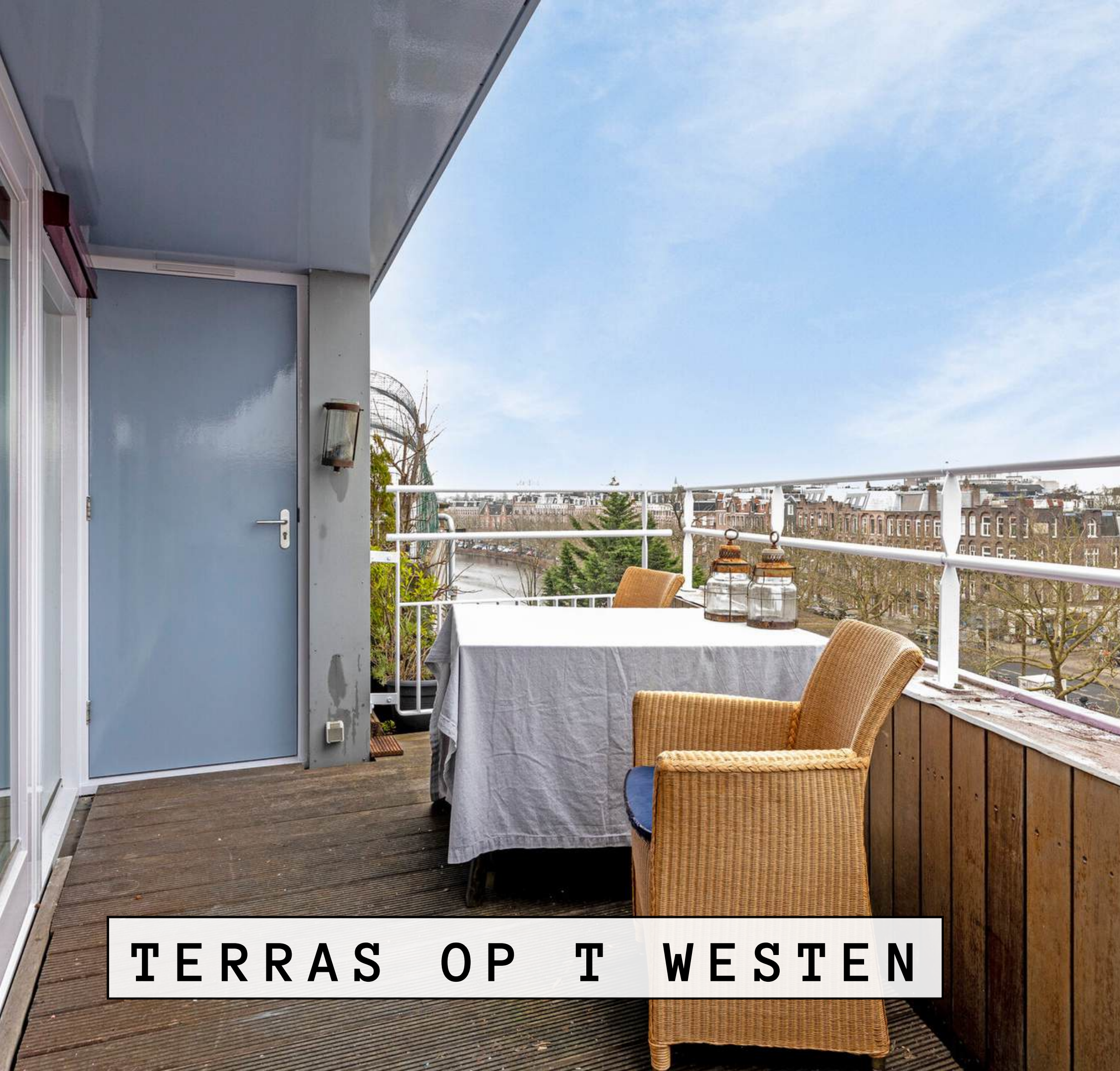
TERRAS OP T WESTEN